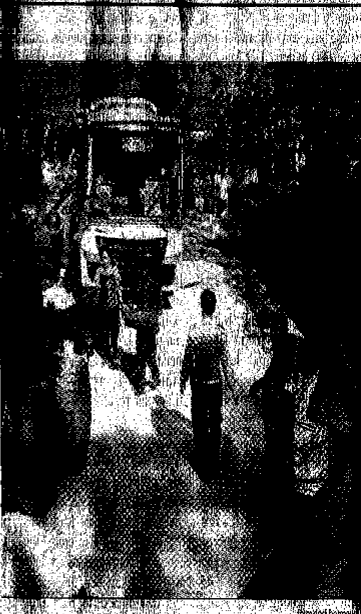
... di Kambang Pamotan Pasiran Desa Nagreg Kecamatan...